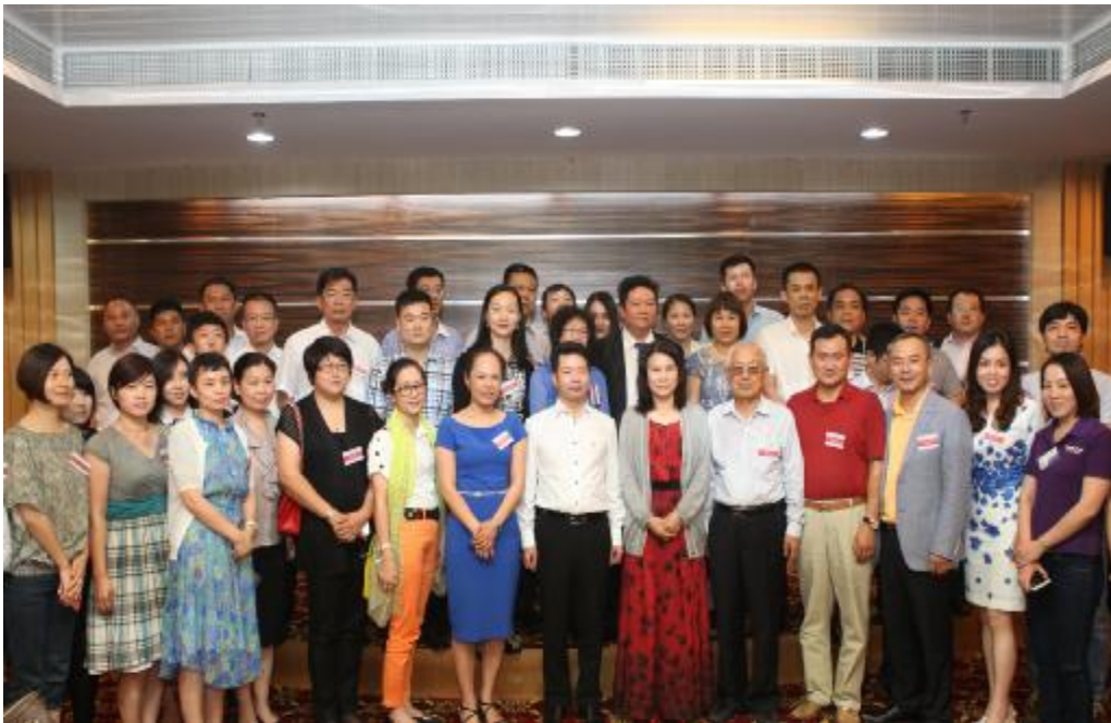
6月12日,广东省工业合作协会组织40多家企业到珠海格力总部问道。