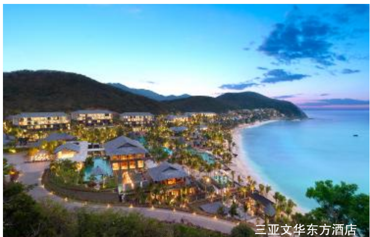
三亚文华东方酒店

本报讯 近日，海南格力销售公司成功与三亚文华东方酒店签订了中央空调采购合同，格力直流变频离心机组将