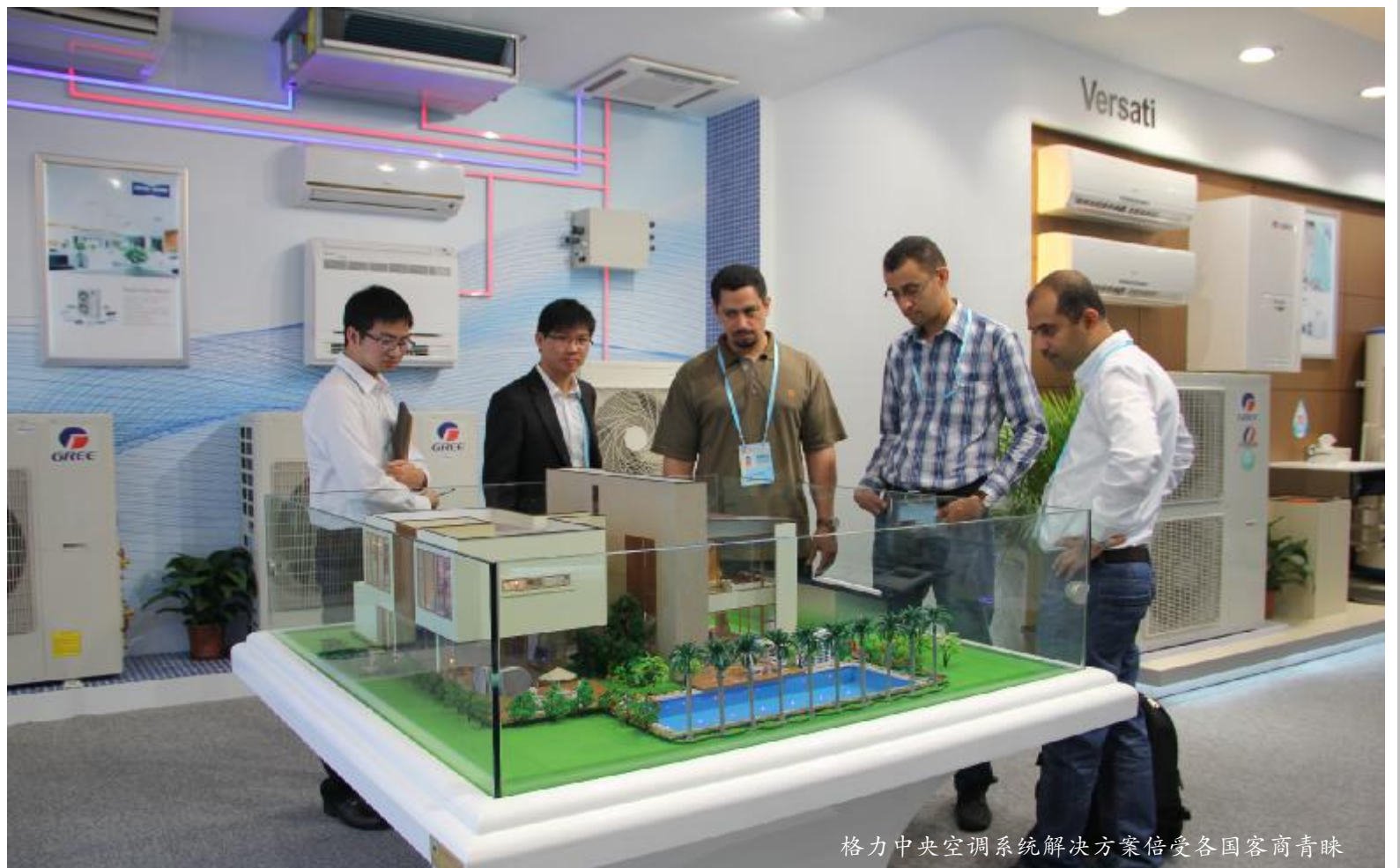
格力中央空调系统解决方案倍受各国客商青睐

广交会开幕当天,国家商务部副部长蒋耀平在参观格力展位时,就格力高效直流变频离心式冷水机组的市场前景和销售情况也进行了详细的了解,并对格力电器取得的业绩给予了高度评价。