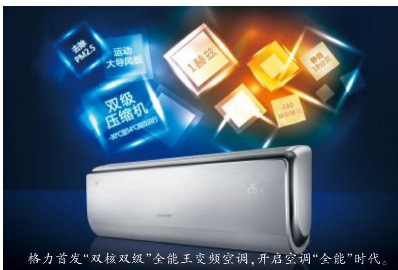
格力首发“双核双级”全能王变频空调，开启空调“全能”时代。

据了解，目前空调行业芯片程序皆为外包，唯有格力芯片为自主编写程序。格力自主开发的全能王双核系统程序，