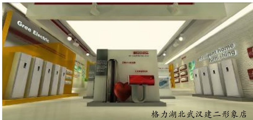
格力湖北武汉建二形象店

据格力公司资料，当前格力自主品牌的空调产品已经进入全球100多个国家和地区，在全球拥有2亿用户。