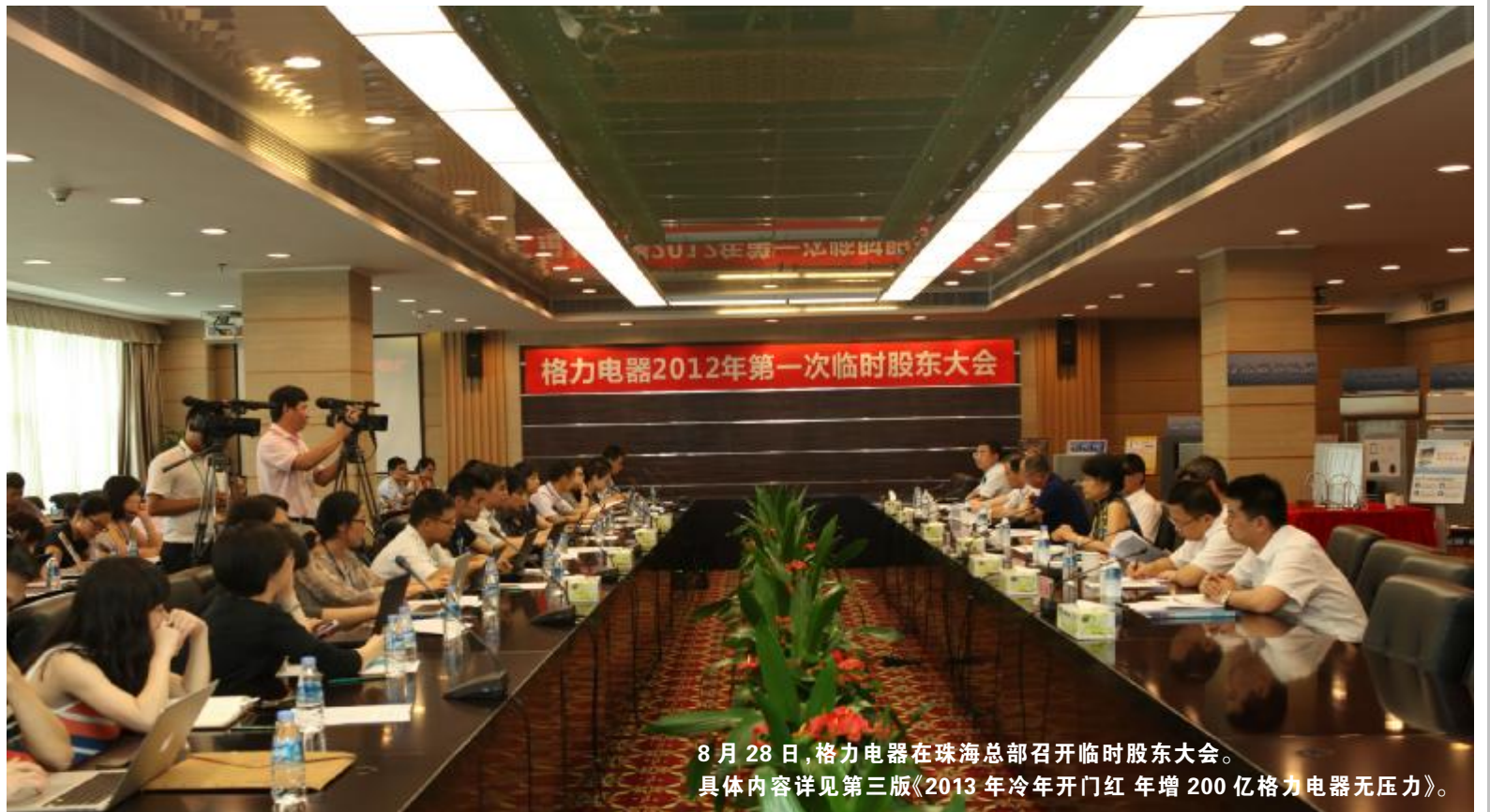
8月28日,格力电器在珠海总部召开临时股东大会。 具体内容详见第三版《2013年冷年开门红 年增200亿格力电器无压力》。

其中,在离心机组市场上,格力实现快速飞跃,市场占有率已经接近甚至赶超约克、开利、特灵、麦克维尔在内的几个美系品牌的企业,中国离心机组市场的寡头垄断格局也进一步被打破;在水冷螺杆机组上,格力也拥有超过10%的市场占有率;在模块机组市场上,格力市场占有率超过20%,遥遥领先全行业;而在单元机市场上,格力独得半壁江山,牢牢占据49.1%的市场份额。(下转三版)