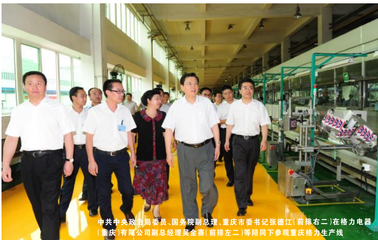
中共中央政治局委员、国务院副总理、重庆市委书记张德江(前排右二)在格力电器(重庆)有限公司副总经理吴金赛(前排左二)等陪同下参观重庆格力生产线

本报讯 8月13日，中共中央政治局委员、国务院副总理、中共重庆市委书记张德江在重庆市委常委、重庆市委秘书长翁杰明、重庆市副市长童小平、台盟重庆市委主委李钺锋及九龙坡区、高新区领导的陪同下重点调研、考察了重庆格力，并高度赞扬格力电器所取得的辉煌成绩。重庆格力副总经理吴金赛、姚小兵、总经理助理岑中富全程陪同参观。