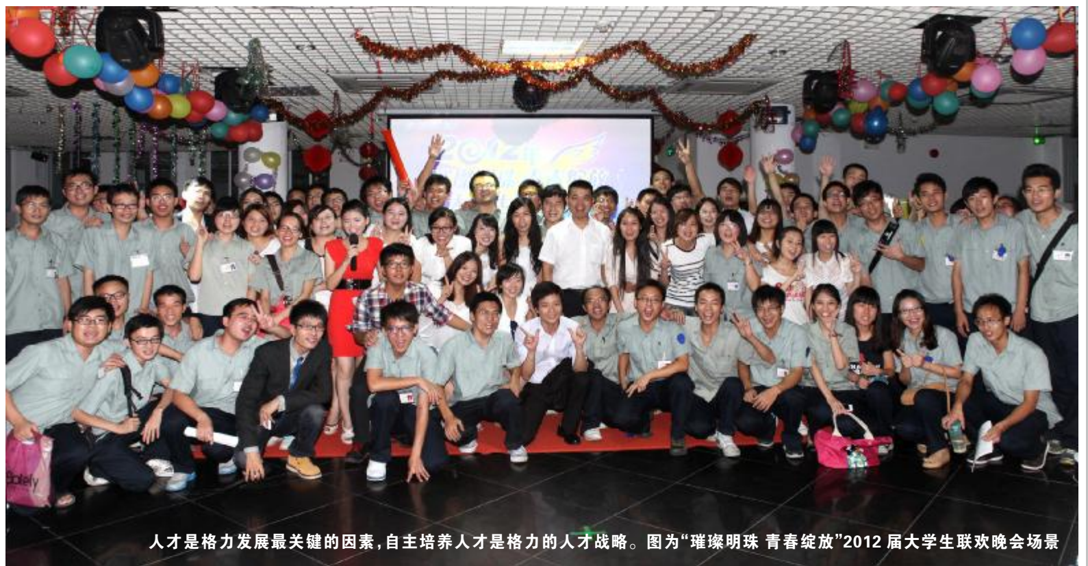
人才是格力发展最关键的因素,自主培养人才是格力的人才战略。图为“璀璨明珠 青春绽放”2012届大学生联欢晚会场景

环球企业家杂志记者陈庆春微博称,看了格力电器半年业绩报表,下半年不出意外今年冲击1000亿问题不大。