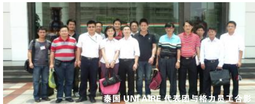
泰国 UNI AIRE 代表团与格力员工合影