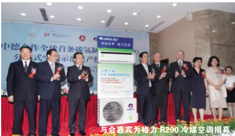
与会嘉宾为格力 R290 冷媒空调揭幕

【上接一版】中国家用电器协会理事长姜风表示，这是中国房间空调器行业在绿色低碳环保制冷剂应用技术上的新突破，对于打破国外技术垄断，掌握自主知识产权、推动中国空调器产业技术进步意义重大。 据中德联合专家组介绍，格力 R290 冷媒空调所有零部件均采用独特的安全设计，拥有十多项技术专利，自主研发的 R290 冷媒专用高效压缩机，使空调整机能效达到国家 1 级标准。