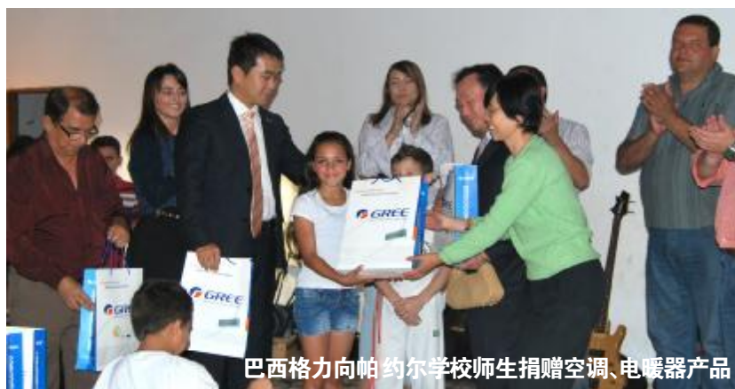
巴西格力向帕约尔学校师生捐赠空调、电暖器产品

帕约尔学校位于巴西污染最严重的铁特河流域。铁特河的污染不仅严重损害了当地居民的健康,也破坏了当地农业环境,导致居民收入来源中断而生活贫困,当地孩子只能依靠慈善机构的捐助时断时续地学习。格力(巴西)有限公司圣