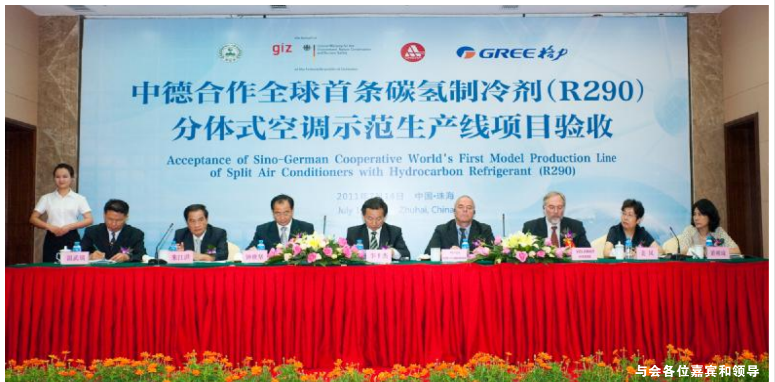
与会各位嘉宾和领导

李干杰表示,R290 作为房间空调器制冷剂,是我国工业界应对臭氧层破坏、气候变暖等全球环境问题的一次勇敢创新,是对低碳、节能、环境友好的发展之路的大胆探索。(下转二版)