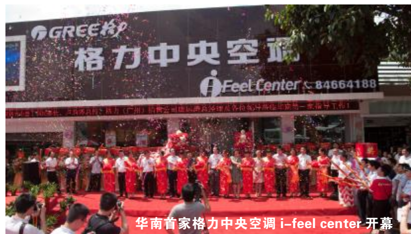
华南首家格力中央空调 i-feel center 开幕

格力空调最先推行专卖店销售的模式,目前全国格力的专卖店已经超过10000家,在专卖店遍布全国各地的同时,格力一直在思索一种与用户更好的交互和销售的平台,也就是一种升级版的专卖店形式,格力 i-feel center 就是这样一种全新的互动体验式专卖