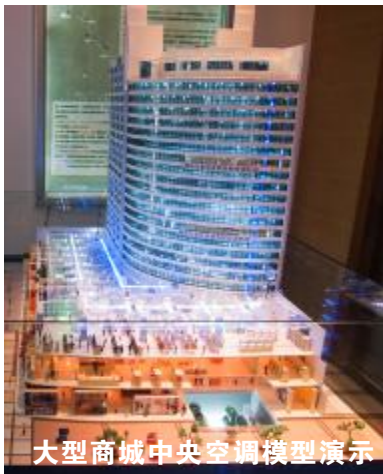
大型商城中央空调模型演示

本报讯 7月23日,华南区首家格力中央空调互动体验中心隆重进驻番禺。据悉,该店是格力电器在华南地区首家中央空调 i-feel center 互动体验中心,是格力电器最新推出的互动式专卖店的模板之一,引进大量中央空调产品实机展示互动,采用多媒体形式演示格力产品优势,让顾客先体验,后购买,是格力电器在专卖店渠道方面的最新探索。