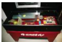
图为东北格力空调旗舰店内景、门头、零部件展示台

无论是从专卖店的硬件设施到装修布置,还是从专卖店人员的管理到服务质量的整体提升都有了系统的规范。