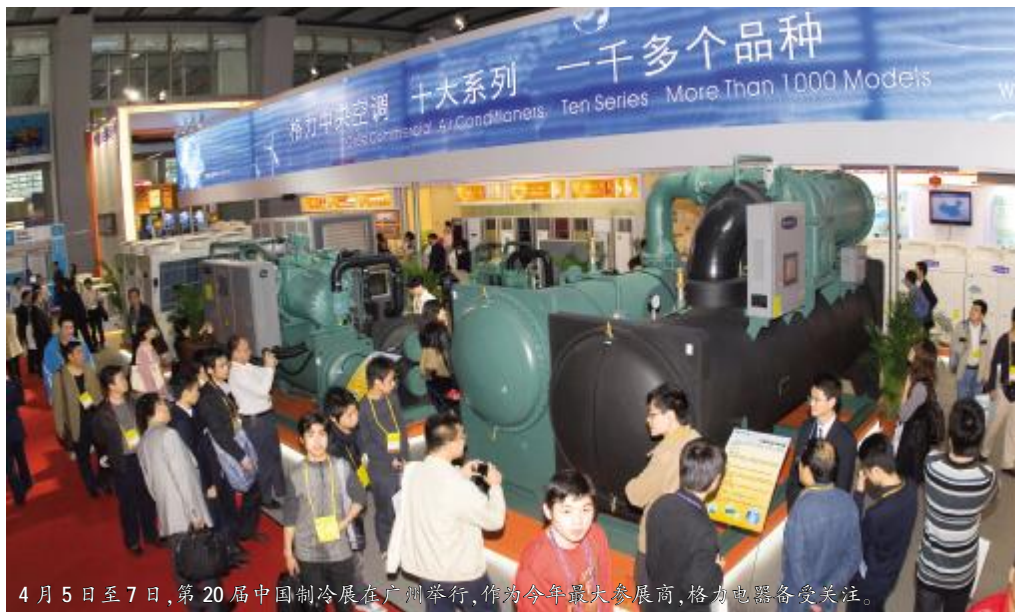
4月5日至7日,第20届中国制冷展在广州举行,作为今年最大参展商,格力电器备受关注。

该中心总投资1.6亿元,其中科技部和地方部门拨款1300万元,采取边组建、边运行的工作方式,建设期3年。目前该中心已开始紧锣密鼓地筹划建设工作。