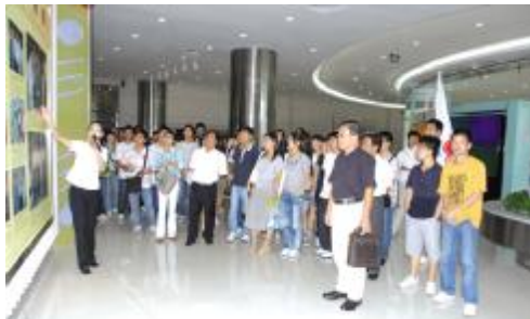
图为亚洲公开大学 2007MBA 的同学在参观展厅

文 / 亚洲(澳门)国际公开大学 2007MBA 林畅 黎莉 邵帅 高宁波 窦继亮