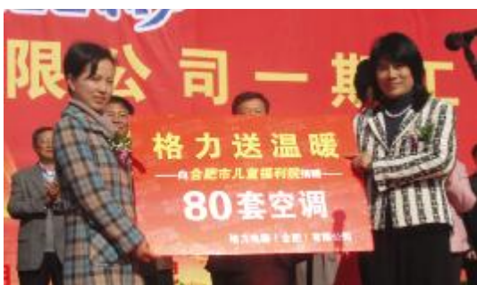
董明珠代表格力电器向合肥市儿童福利院赠送80套格力空调

(套)，同时扩建年产能30亿元的商用空调项目；今后根据市场发展的需要，还将建设年产能300万台的压缩机等项目。