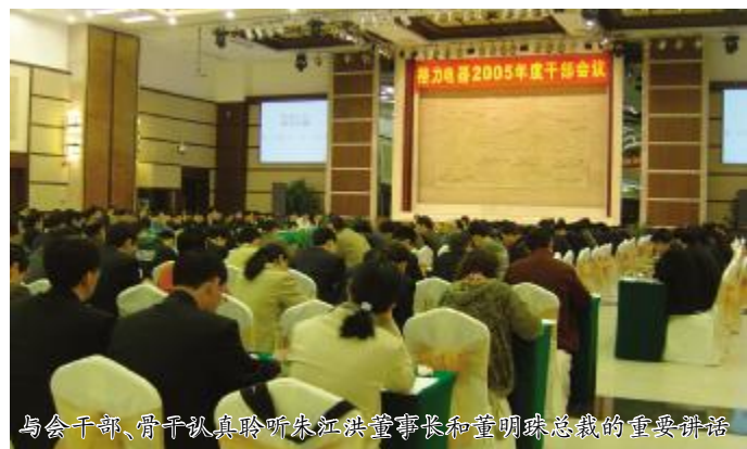
与会干部、骨干认真聆听朱江洪董事长和董明珠总裁的重要讲话

本报讯 1月4日至5日,一年一度的格力电器干部大会在广东新会会东温泉度假村隆重召开。格力电器高层领导、各部门分厂、分公司、控股公司干