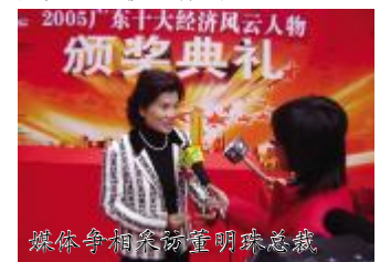
媒体争相采访董明珠总裁

研究中心、广东省中小企业局、广东省工商业联合会、南方广播电视传媒集团、羊城晚报报业集团、广东电视台、第一财经日报共同举办的“2005 广东十大经济风云人物”评选活动,旨在评选出在广东经济领域具有突出贡献的领军人物,寻找在自主创新等领域中坚决迈出第一步的时代精英。该活动的评选范围包括在广东省内,依法为广东经济建设和社会发展做出重大贡献或突出贡献,有代表性的企业家、经济学家以及台港澳同胞在我省投资的实业家。评选标准为进取性、创造性和公益性,即:勇于挑战困难,挑战自我;长期奋斗在广东经济的最前线,推动广东经济不断迈向新的制高点;理论创新、体制创新、管理创新、技术创新;观念手段等方面的独创性预示了经济发展的某种趋势,以创造性的工作开拓出经济发展领域的新天地;热心公益事业;倡导绿色经济,打造循环经济的模式,在能源和资源的节约和综合利用上先人一步,为创造节约型社会充当了楷模和先头兵的模范作用。